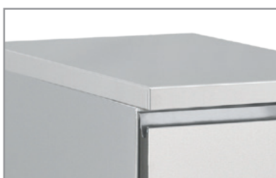
Superficie interna ed esterna acciaio inox Stainless steel body and inner liner