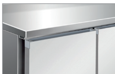
Superficie interna ed esterna acciaio inox AISI 304 AISI 304 Stainless steel body and inner liner