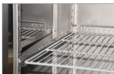
Mensole a scorrimento Sliding shelves