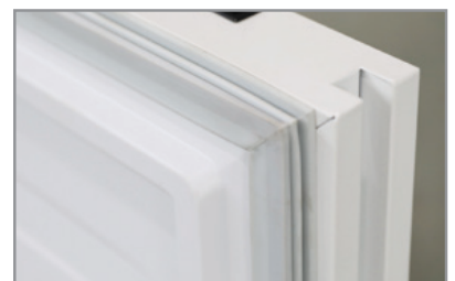
Maniglia integrata Built-in handle