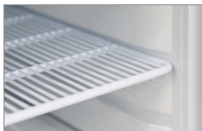
Mensole rinforzate (versione TN) Reinforced shelves (TN model)