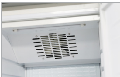
Ventola assiale Axial fan