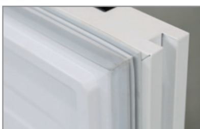
Maniglia integrata Built-in handle