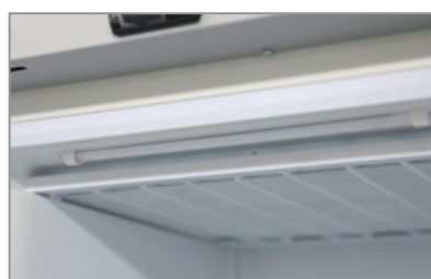
Illuminazione LED LED lighting