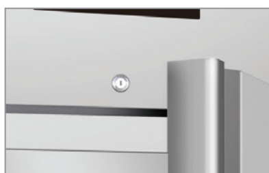
Chiave e serratura Lock and key