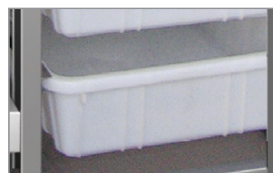
Vaschette in plastica Plastic baskets