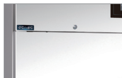
Chiave e serratura Lock and key