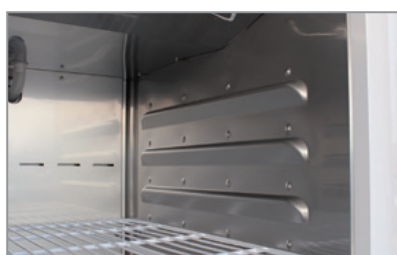
Lamiera interna stampata Thermoformed stainless steel innerliner