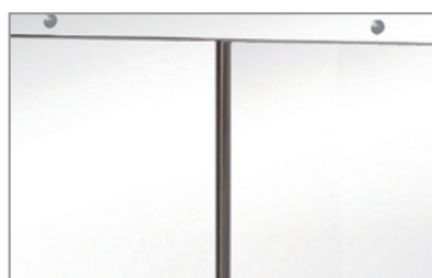
Maniglia integrata Built-in handle