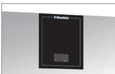
Termostato elettronico Electronic thermostat