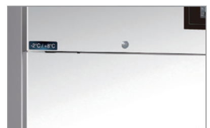
Chiave e serratura Lock and key