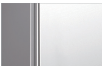
Maniglia integrata Built-in handle