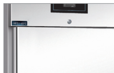
Chiave e serratura Lock and key