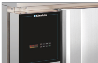
Termostato elettronico con 4 programmi Electronic thermostat equipped with 4 setting programs