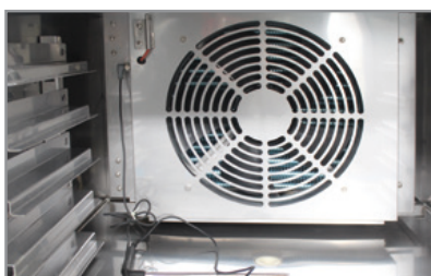
Sonda di raggiungimento temperatura prodotto Product temperature probe