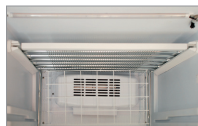
Motoventola tangenziale Tangential fan motor