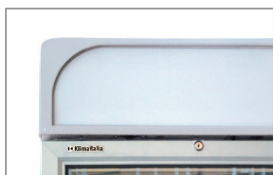
Cassonetto retroilluminato Backlight canopy