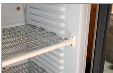
Refrigerazione statica Static refrigeration